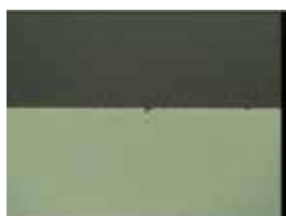
■ 背面崩边(Si 晶圆)