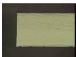
■ 切割条纹(Si 晶圆)