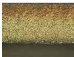
■ 加工后的刀片表面